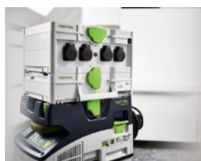
Módulo Bluetooth® BT-CT 26-48 I